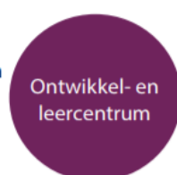
Figuur 2. Een vijfde model (Taskforce, 2017)

5 Ontwikkel- en leercentrum Organisatie: 1 Dienst: 1